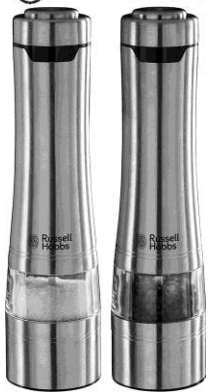
Soola- ja pipraveski 23460-56